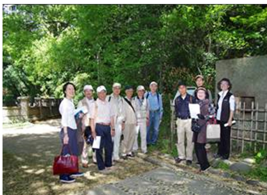
写真上 松溪ふれあいの家