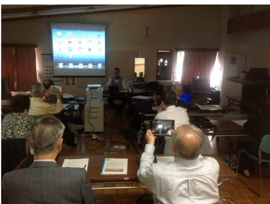
写真上 タブレット勉強会