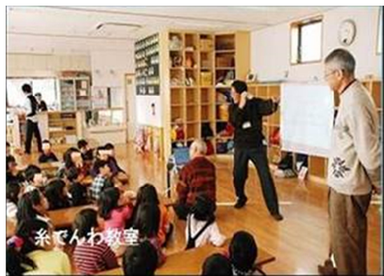
写真上 ねんりんピックでの教室風景