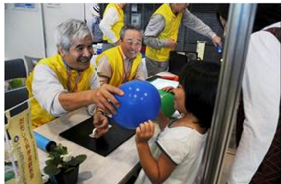
空気を抜くところよく探して、この会話が楽しい