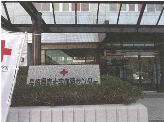
Fig 2. 長崎県赤十字血液センター 外観2