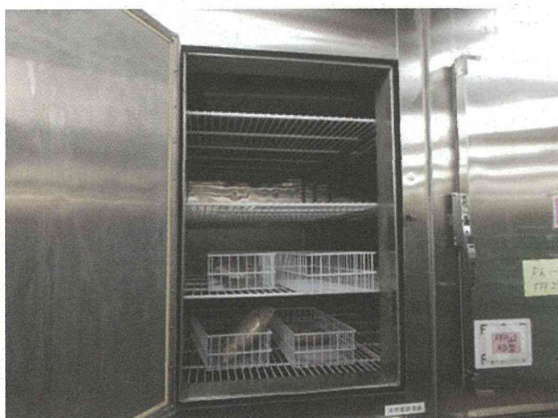
Fig 4. FFP 保冷库

RCC/21日、FFP/1年、血小板/4日のそれぞれ有効期限が設けられている。特にFFPは -20^{\circ}\text{C} 以下での保存・管理となっており、使用時における凝固活性維持のために欠かせない保管条件である。無論、一度解凍したFFPは制限時間内(3時間以内)に使い切らなくてはならず、余剰FFPの再利用は出来ない。