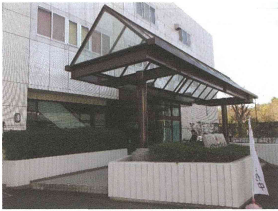
Fig 1. 鹿児島県赤十字血液センター 外観1