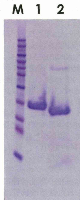
図 1. マウス APOBEC3 N-末端ドメイン (mA3 Z2) の精製 M: 分子量マーカー Lane 1: His-タグがついた状態 Lane 2: His-タグ切断後のイオン交換クロマトグラフィーにより精製された mA3 Z2.

上記2)の pull-down アッセイ系に加えるマウスレトロウイルスタンパク質に、C-末端側から20アミノ酸残基ずつの欠失を加えた。その結果、マウス