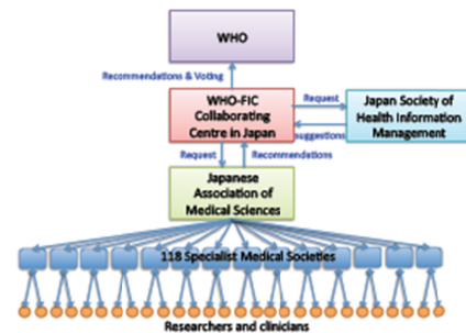
Figure 1 Former and the new scheme for the ICD updating and revision in Japan