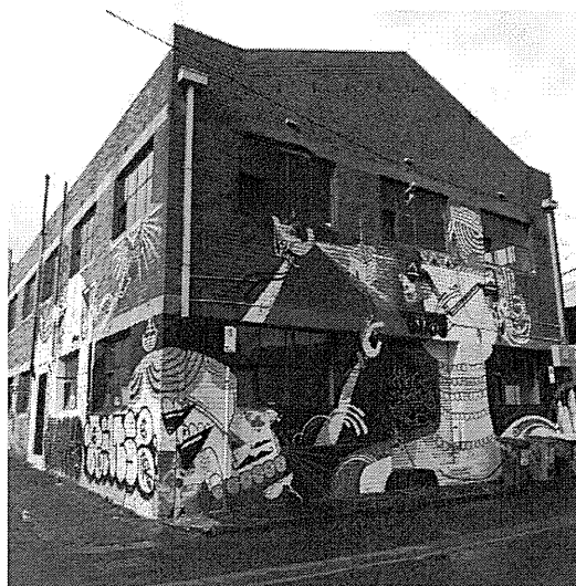
1) Lighthouse 財団事務所の概観