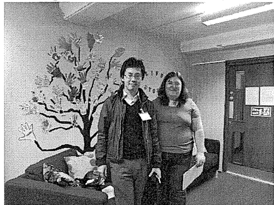
↑ 3. Life Story Worker と LSW 作業室