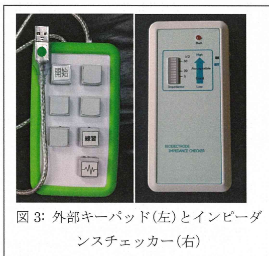
図 3: 外部キーパッド(左)とインピーダンスチェッカー(右)

まず、周辺機器として、簡単な操作を行うための外部キーパッドを作成した。ボタンの数は 7 個とし、それぞれのキー表面に機能がアイコンで示されている。また、このキーパッドには外部入力端子の受付があり、この端子に外部入力機器を接続することでボタンや筋電スイッチを利用することが出来る。また、本機器を脳波で使用する際の脳波電極設置のために、簡易なインピーダンスチェッカーを用いた。これはバー型の LED の色を見ることで十分な電極の設置が出来ているか