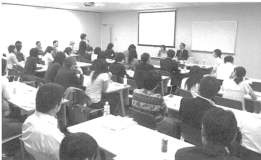
第5回「がんと就労」勉強会

オープン参加ですので、どのようなお立場の方でもご参加いただけます。がんと就労について、さまざまな視点から広く話し合うフォーラムづくりを目指しています。