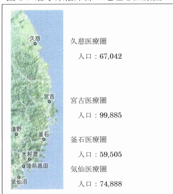
図 1. 岩手県沿岸部の地理と医療圏

岩手県の面積は、東京都と埼玉県、千葉県、神奈川県を合わせた面積よりも広い。沿岸部は南北の距離が約 200 km あり、この医療圏は北から順に久慈、宮古、釜石、気仙の 4 つからなっている。