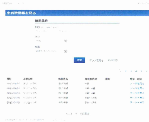
図 4. 情報選択画面