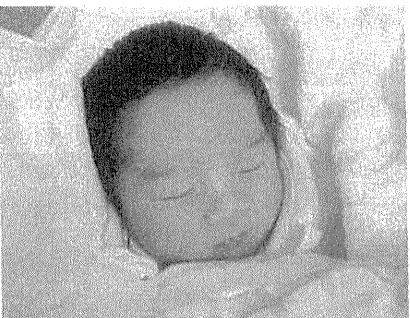
写真は記事とは関係ありません

私は、厚生労働省研究班・妊娠中の化学物質による情動・認知行動への影響についての研究の、研究代表者として、妊婦さんの周辺にあふれる化学物質が子どもの発