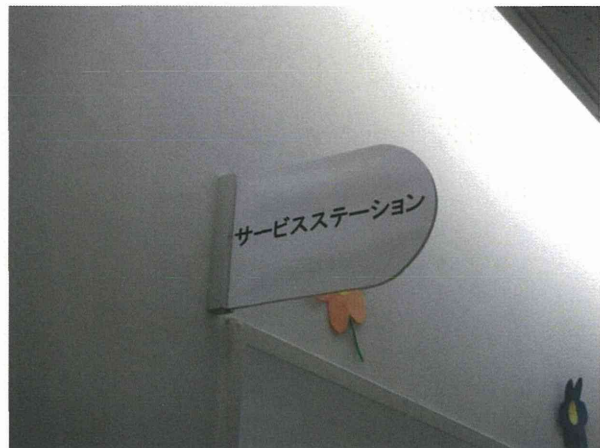
看護職員がいるサービスステーションの表示