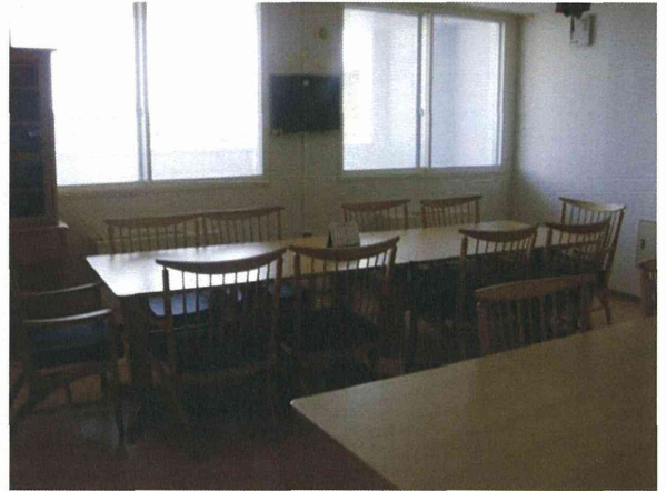
食事等のスペース