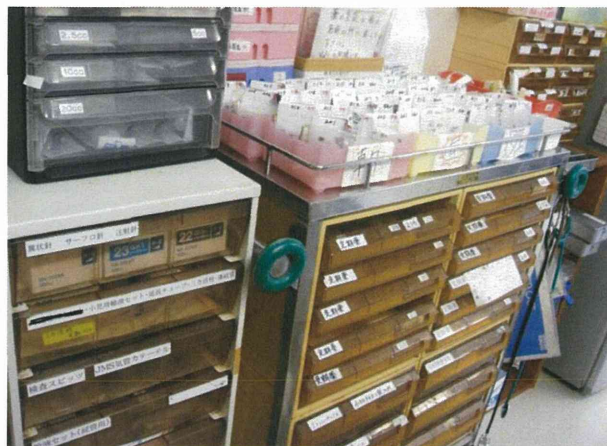
サービスステーション内の配薬カート