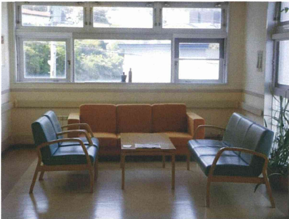
廊下の一部にある面会スペース