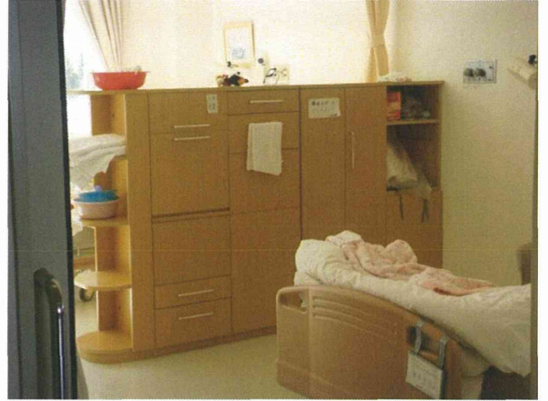
多床室を仕切る個人用の棚