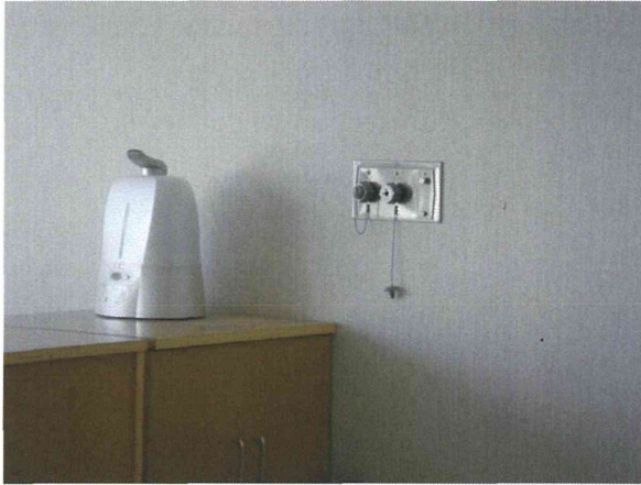
多床室にある吸引の配管