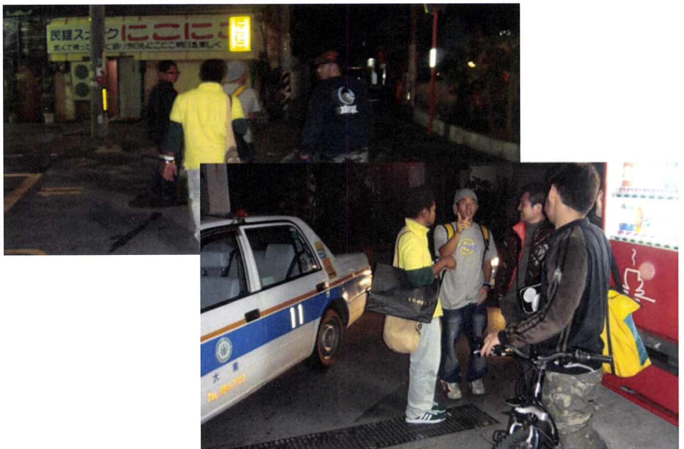
ゲイバーへの開発資材配布 週1回の配布体制の整備