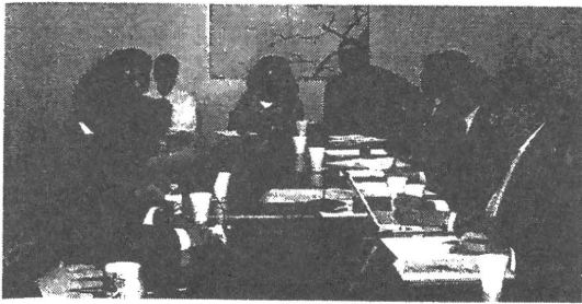
図1 ACTチームのミーティング

さらにピアスタッフ1人)が24時間体制でかかわっているが、一人あたり月に6~8回の訪問が標準である。ACTサービスを受けているのは、いずれも重度の精神症状が継続している患者 (severely and persistently mentally ill individuals ; SPMI) で、このうち20人は裁判所から通院命令を受けている (assisted outpatient treatment ; AOT) 患者である。SPMIでもすべてがACTの対処ではなく、過去1年以内に3回かそれ以上の入院を繰り返した場合 (もしくは、連続90日以上入院・施設入所) やAOTを受けている患者に限られる。入院が2回までの患者や、3回以上救急室を受診した患者、あるいはホームレスなどは、集中的ケースマネジメントを受けることが求められる。