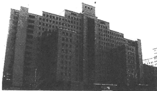
図2 Kirby forensic psychiatric center

病棟 (定床26床) スタッフは医療チーム9人 (精神科医1人、内科医0.5人、心理士1人、ソーシャルワーカー1人、看護師2人、看護助手3人、リハビリテーションカウンセラー1人) で、保安関連要員は全病棟に40人が配置されている。このほかに病院としては司法評価者、コンサルタント、