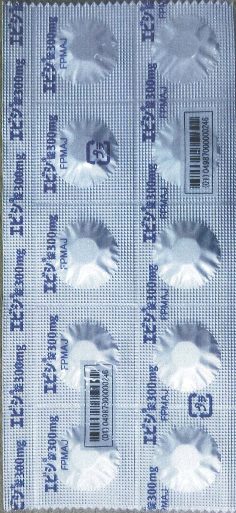
資料7-1 SP包装サンプル36