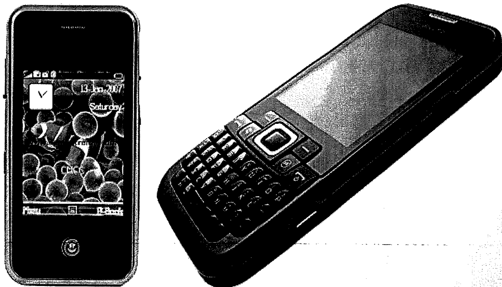
▲ 携帯電話から PC サイトが閲覧できる携帯電話の一例。(左：iphone 右：series SC-01B)

近年、携帯電話から直接 PC サイトを閲覧できる機能が登場。その為、アクセス解析でも、PC サイト、モバイルサイトの解析及び、モバイル端末から PC サイトへアクセスした状況も別に調べる必要がある。今回の解析では、上記の携帯電話から PC サイトを閲覧した状況も追加調査する。上記新機種が広く普及すれば、いずれは PC サイトのみで対応できる可能性もあるが、その普及は始まったばかりであり、費用の面でも今後の展開は未知数であるため、当面はこれまで同様 PC サイトとモバイルサイト、それぞれ独自のサイト開発が必要であると考えられる。