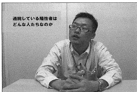
ソーシャルワーカーのインタビュー映像

ソーシャルワーカー：ソーシャルワーカーの役割／ソーシャルワーカーへのアクセス／地域の支援者とソーシャルワーカーの関わり方／通院している陽性者はどんな人たちなのか／陽性者の方からいつどんなニーズが発生するのか／地域の支援者へのアドバイス