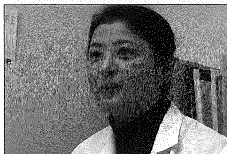
看護師のインタビュー映像

看護師 ：国立国際医療センターエイズ治療・研究開発センター（ACC）におけるコーディネーターナースの役割／地域の支援者とコーディネーターナースの関わり方／通院と服薬の頻度／初めて来院した人へ／ACCと地域との連携／制度の利用について／支援者が HIV 陽性者本人の情報を得たい場合／企業の人事担当者へのアドバイス／支援者へのアドバイス