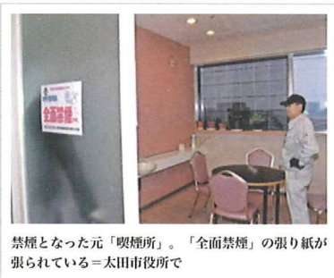
禁煙となった元「喫煙所」。「全面禁煙」の張り紙が張られている=太田市政府で

太田市は二日、庁舎や行政センターなど百八十一あるすべての市有施設を全面禁煙にした。公共的な施設は原則全面禁煙にするよう求める厚生労働省の通知を受けた措置。同省によると、庁舎を全面禁煙にしている自治体は少なくとも「市有施設すべてというのはいない」としている。(健康局)としている。 (加藤益丈)