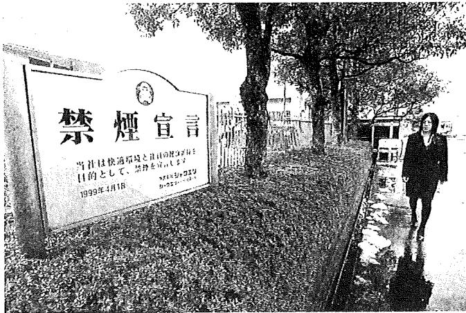
社員の健康維持を目的に全社禁煙を宣言した福井県敦賀市の「ジャクエツ」本社