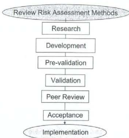
Fig. 1: Stages in the development of new toxicological testing methods

少なくとも、行政への申請に係る安全性試験に関しては、国際的な取り決めが必要である。そこで、