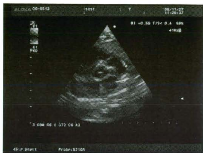
図3 送信された動画像の一部-6 動脈管開存カラードプラ