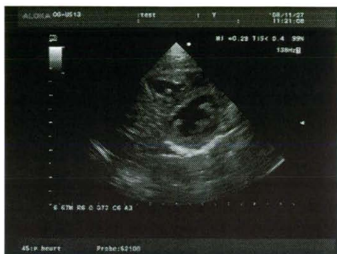
図3 送信された動画像の一部-2 左心室短軸