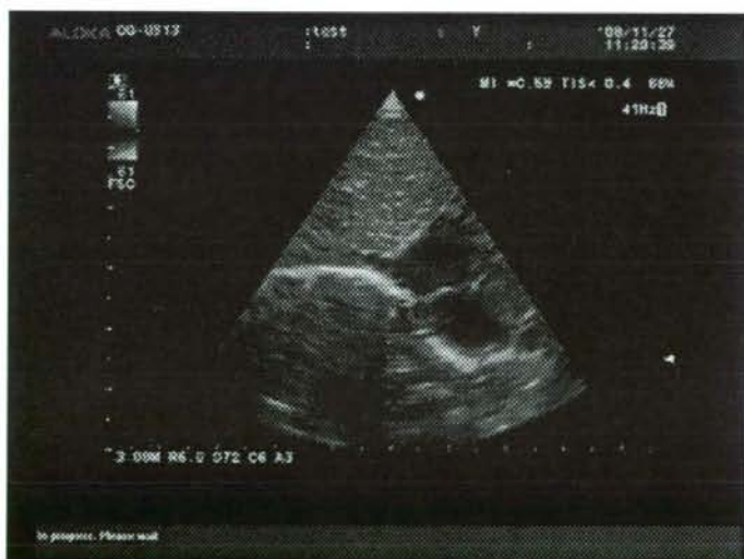
図3 送信された動画像の一部-7 下大静脈レベル