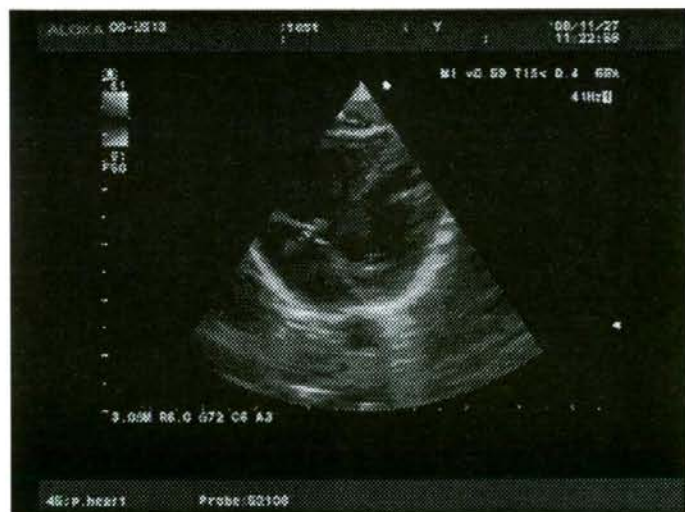
図3 送信された動画像の一部-5 三尖弁逆流カラー