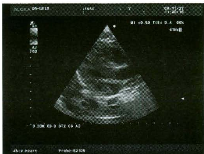
図3 送信された動画像の一部-4 長軸カラー Doppler