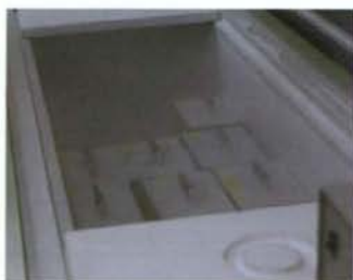
ディープフリーザー

ご検体は、超低温槽というマイナス80度で保存できる特別なフリーザーで凍結します。また、匿名化・番号化したうえでバーコードによる管理を行っています。さらに、予備のフリーザーも用意して、貴重な死後脳を決して無駄にしないような体制を整えています。