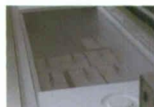
ディープフリーザー

死体解剖保存法にのっとって病理解剖を行います。摘出された脳の左半分、つまり左脳は、病理診断に使われます。これは、亡くなった方