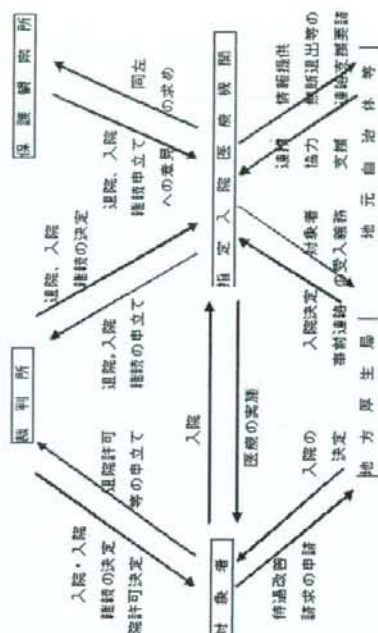
図2 指定入院医療機関の役割（指定入院医療機関を中心に）