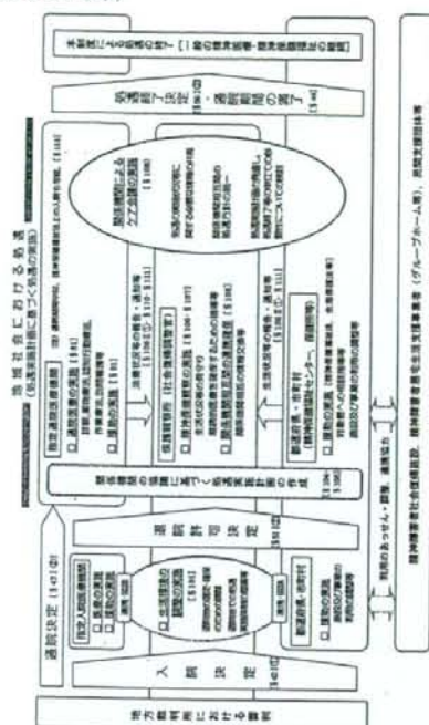
図 3 地域社会における処遇（§は医療観察法の該当条文を示します）