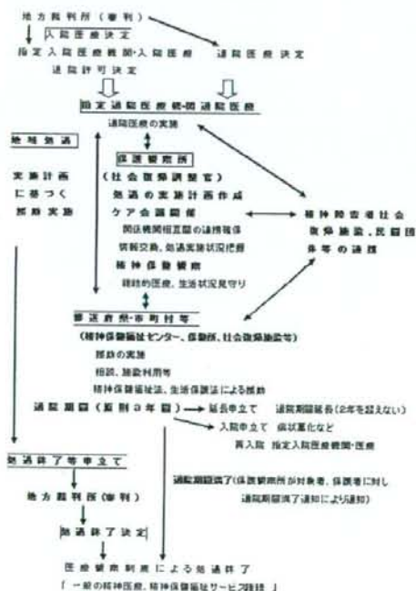
図6 地域社会における処遇の流れ