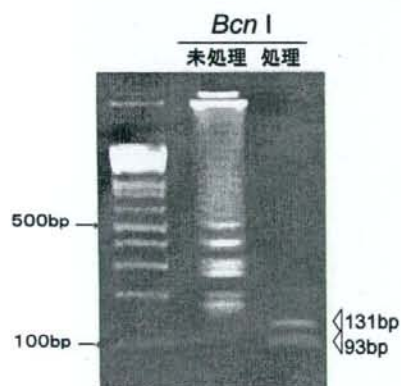
図2. LAMP法によるらい菌遺伝子増幅産物及び制限酵素処理後産物の電気泳動像。

国、インドネシア各国分離株を供試し、いずれの株においても増幅が可能であった。LAMP法は、その増幅特性より莫大な量の産物が生じ、電気泳動法による確認は、室の重篤な汚染を引き起す可能性があり、非常に煩雑な手技を必要とし、結果の信頼性を揺るがしかねない。そのため簡易検出法として、Fluorescent Detection Reagent (栄研化学)を用いた。反応前の反応液に添加し、産物が産生されると副産物との反応により紫外線照射により、陽性ならば緑色、陰性ならば濃茶を示し、チューブを開封することなく結果判定が得られる。