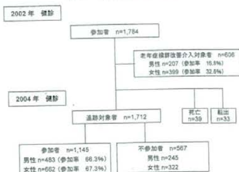
図1 お達者健診の流れ