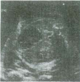
UCSF method (original)