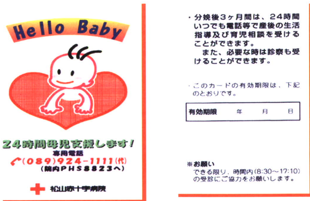
<図15>ハローベビーカードの表と裏

カード保持者から院内PHSに電話連絡が入ると、平日時間内では病棟助産師は相談内容により産婦人科又は小児科外来に連絡し、必要により医師が対応・診察する。休日・時間外では病棟助産師は当直産婦人科又は小児科医師に連絡し、診察時は日直・夜勤看護師が対応する(図16)。