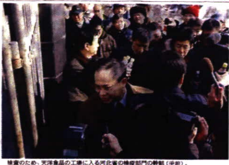
検査のため、天津食品の工場に入る河北省の検査部門の幹部(手前)。後方では、検査部門の関係者が、検査中に清潔飲料水を配っている。31日午後、中国河北省石家庄市で、移転工場撮影。

回収商品で 症状訴え拡大 厚労省が回収したギョーザ以外の食品も検査対象に拡大し、回収された食品が、症状を訴える人が増えている。厚労省は、回収された食品が、症状を訴える人が増えている。厚労省は、回収された食品が、症状を訴える人が増えている。