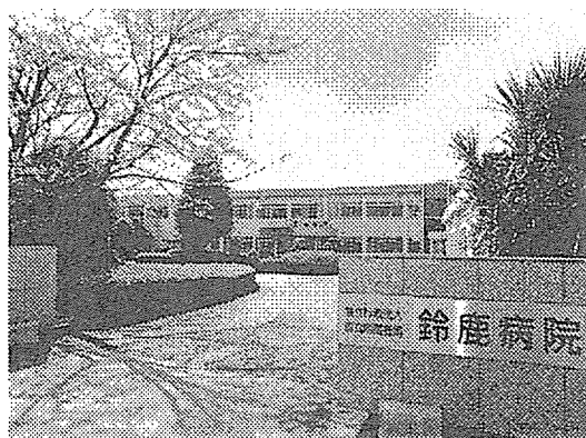
写真. 鈴鹿病院正門前風景

上記を踏まえ、平成 16 年度に、本研究班では、多くの医療依存度が高い障害児・者が生活を営まれている、独立行政法人 国立病院機構 鈴鹿病院（以下、鈴鹿病院とする。）が研究フィールドとして適切であると考え、研究協力を依頼し快諾を得た（参考：鈴鹿病院ホームページ： http://www.hosp.go.jp/~suzukaww/menu.html ）。