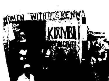
ナイロビ・キアンビウ地区にある KENWA のドロップインセンター