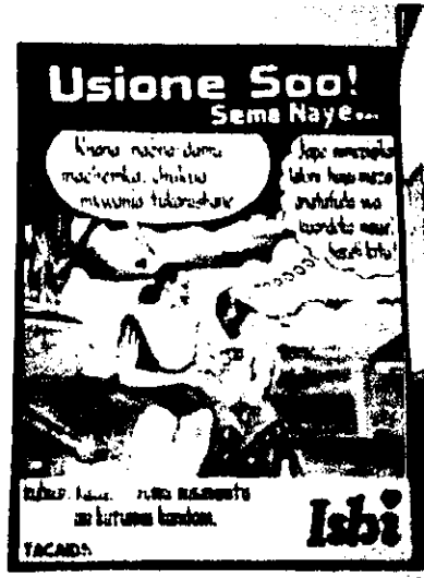
タンザニア・キリマンジャロ山麓のモシのバスターミナルにあるエイズ予防啓発の壁画。

また、先に述べた SHDEPHA+が、国際 NGO である AIDSETI (AIDS Empowerment and Treatment International) と連携して、非常に小規模ですが、ART のプロジェクトを実施しています。