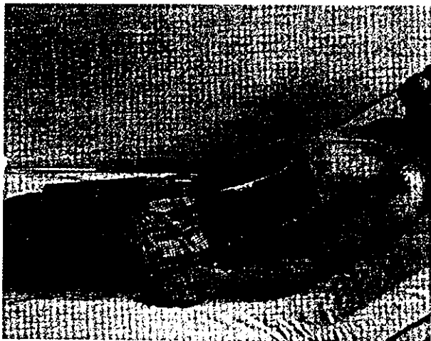
図1 小パッドを用いた体温管理(Artic Sun社)

置は、患者体温をモニターしながら自動的に水温を調節し、約90～120分で、33～37°Cの目標温度に到達できる特徴がある。しかも、従来のような大がかりの2枚のブランケットで患者を挟むことなく、2～5枚の小パッドを背中・胸・腹部や大腿部の体に貼り付ける(図1)方式であるため、患者処置、看護や移送なども容易に行える特徴がある。温度管理パッドが小さく、直接患者に貼り付けるため、熱の放散が少ないので、救急・蘇生室などの場所でも素早く、かつ高率良く患者体温を管理することができ、今後の新しい方法として注目される。