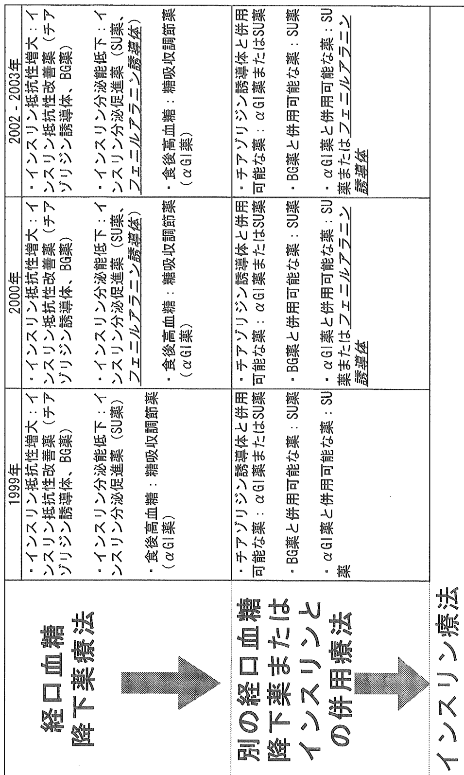
表 4 糖尿病診療ガイド概要 (日本糖尿病学会)

BG薬：ビグアナイド薬 SU薬：スルフォニル尿素薬 \alpha GI薬： \alpha グルコシダーゼ阻害薬