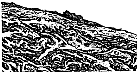
Figure IX-3 Dorsal skin Moderately degeneration Aldh2 -/- , 500ppm acetalddehyde exposure case