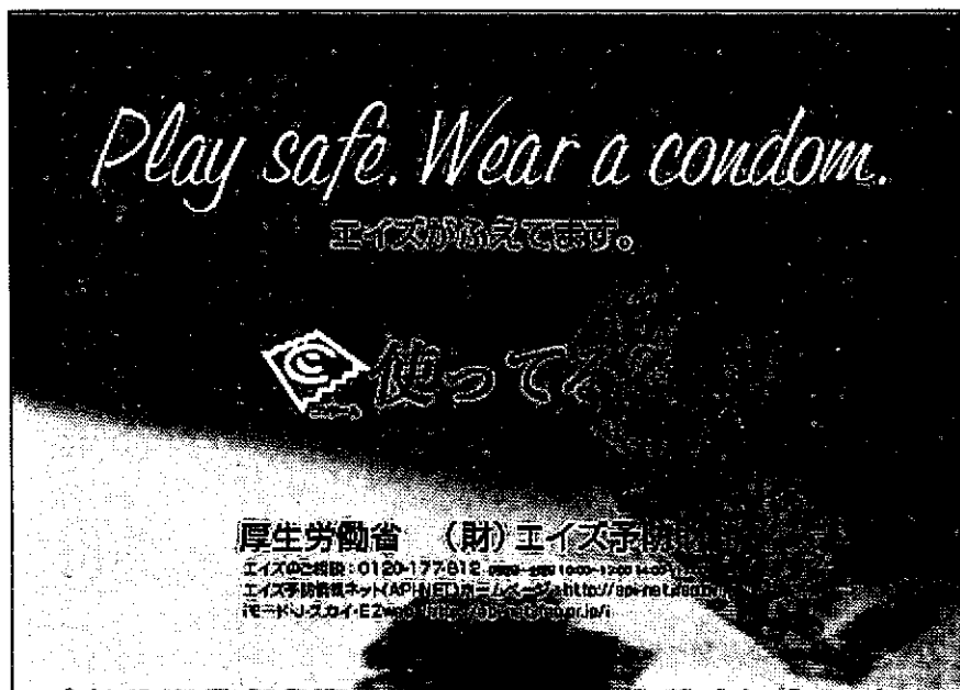
写真 (C) 電車内窓上広告