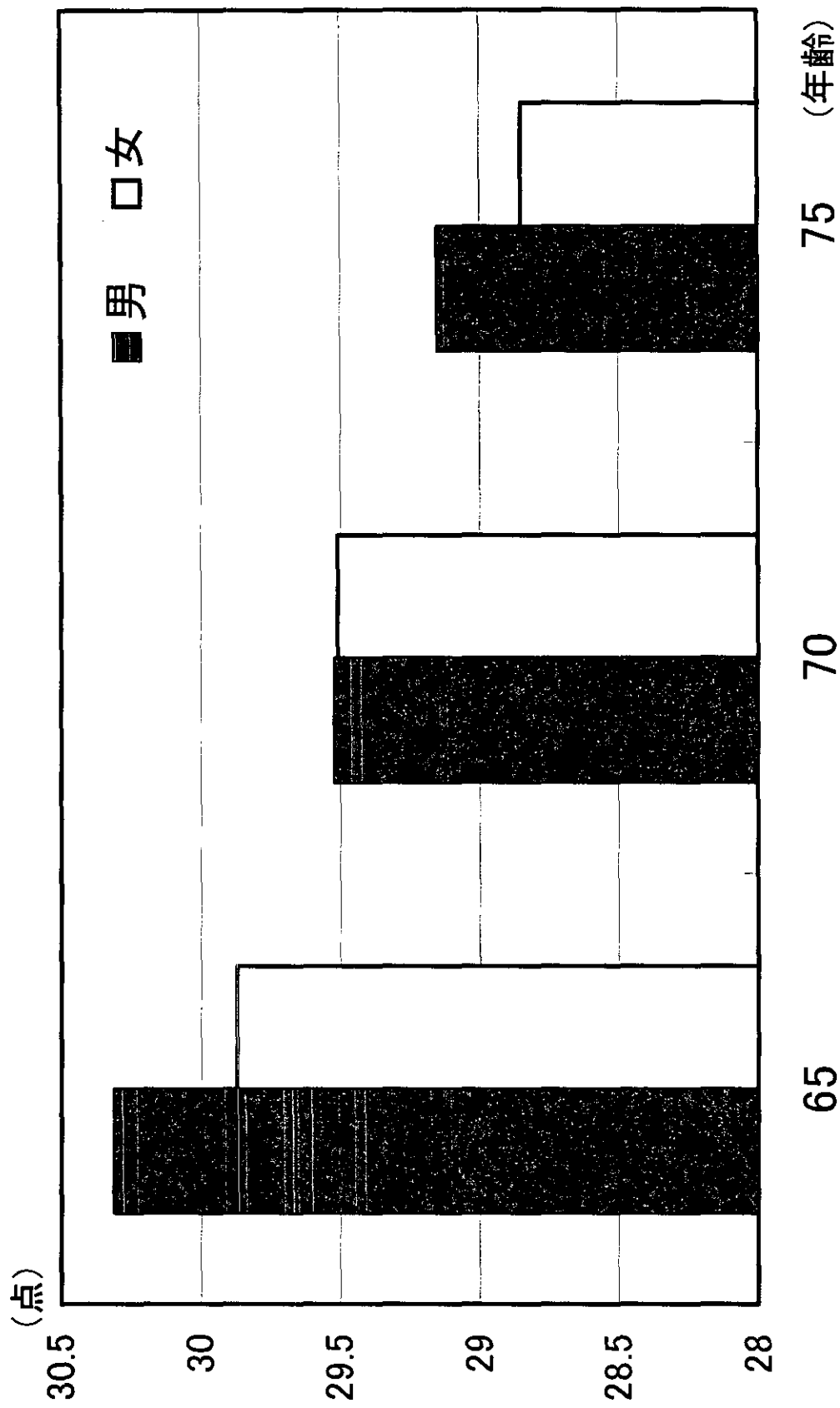
Figure4 うつスケール得点