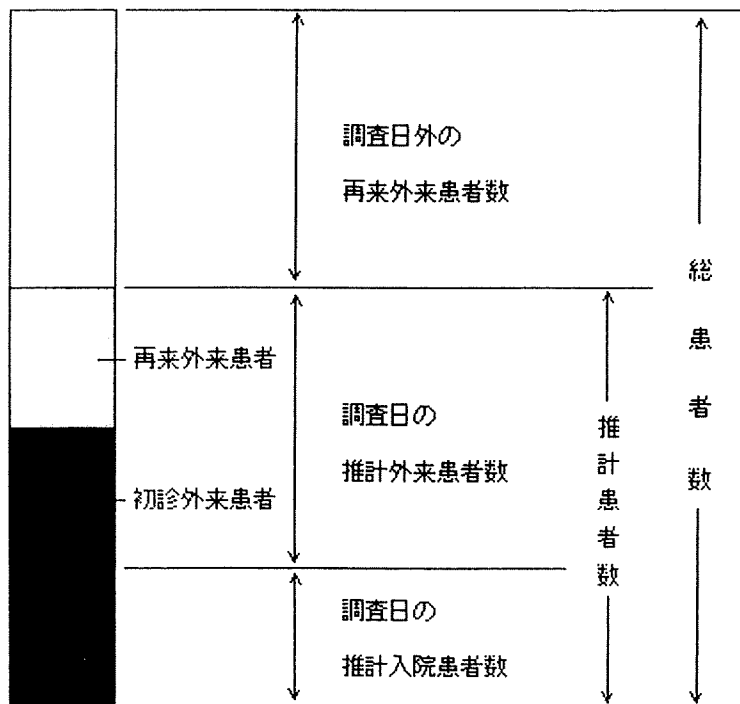
図 3. 患者調査における総患者数の考え方 (平成 8 年患者調査より)